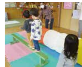
↑1月 上長与児童館 「大型遊具で遊ぼう」