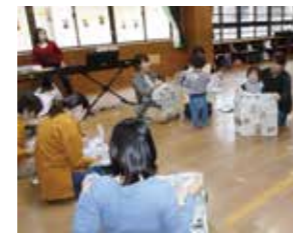
↑12月 高田児童館 「親子でリズムク」

内 自由あそび・手あそび・リズムあそび・読みきかせなど（都合によりスケジュールが変更になることがあります。ご了承ください）