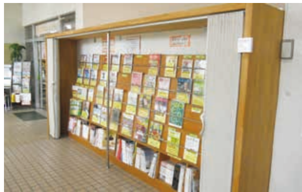
長与町図書館 雑誌架 ▲

事業主の皆さまに、雑誌購入のスポンサーとして、広告掲載料を負担していただく代わりに、雑誌の最新号の表・裏表紙に広告を掲載させていただき、その分の収入を、図書館雑誌購入費用や、サービスの充実などの財源確保に活用するものです。