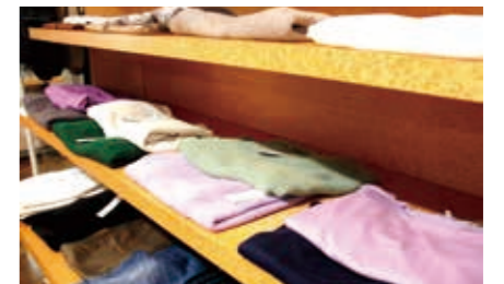
▲店内に並ぶおしゃれな洋服