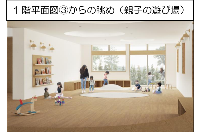
1階平面図③からの眺め(親子の遊び場)

未就学児を対象にした屋内の遊び場です。ここから屋外の遊び場へ出ることもできます。