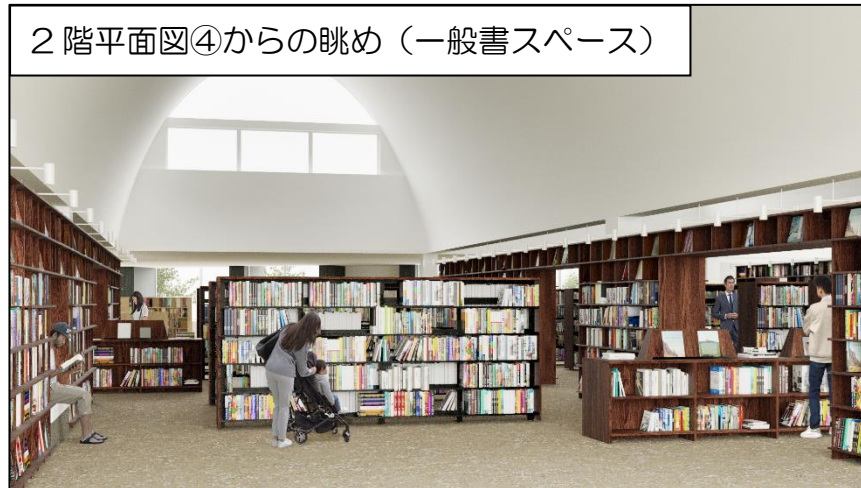
2階平面図④からの眺め(一般書スペース)

2階全体が図書館となっています。ゆっくりと読書ができるように多くの席を設置します。