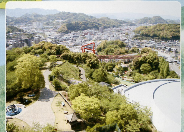
展望所からの眺め