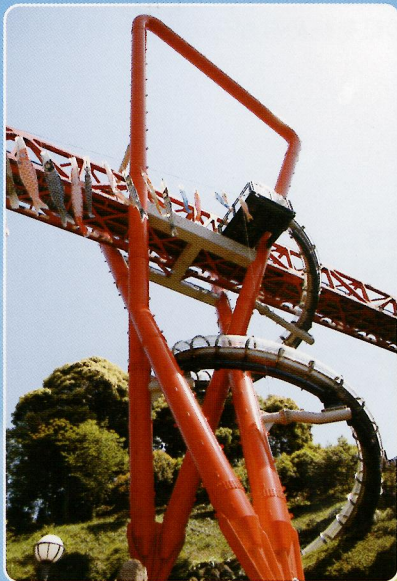
スパイラルスライダー