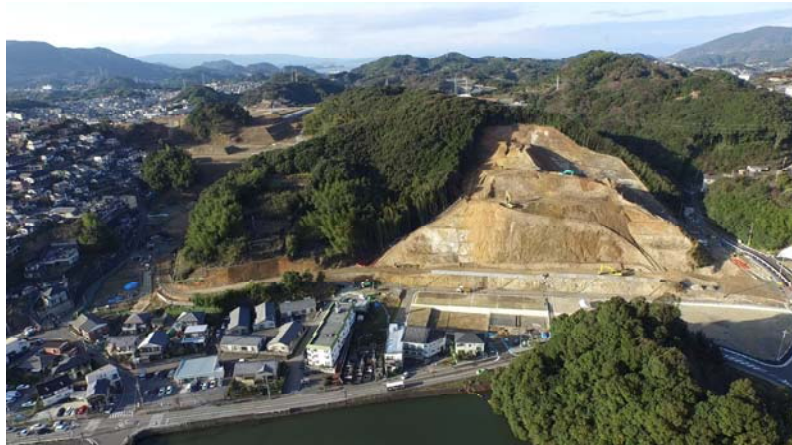
(浦上水源地側から南東部地区を望む)