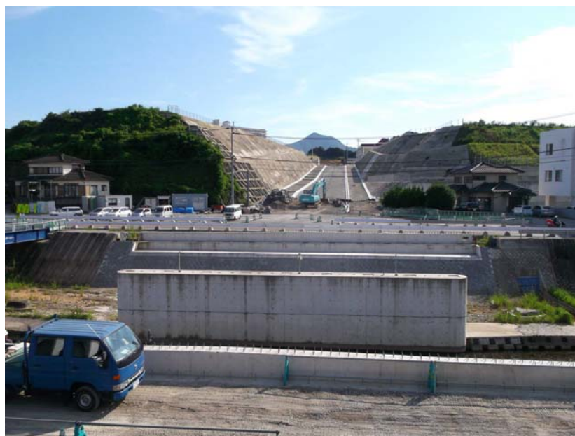
(役場側から橋梁架設箇所を望む)