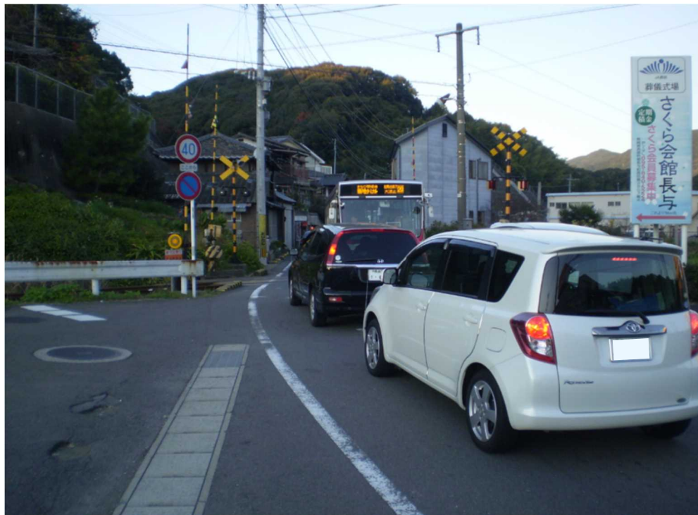
改良予定の JR 高田踏切