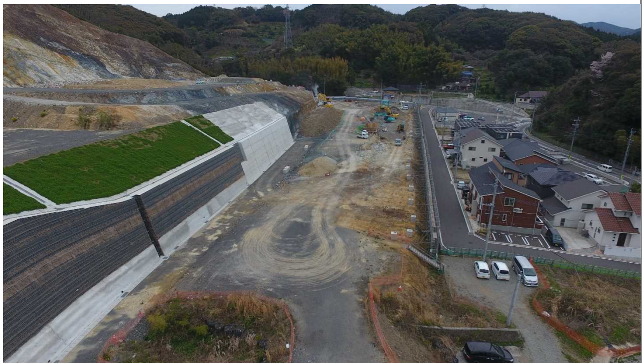
整備が進む南東部地区（浦上水源地付近）