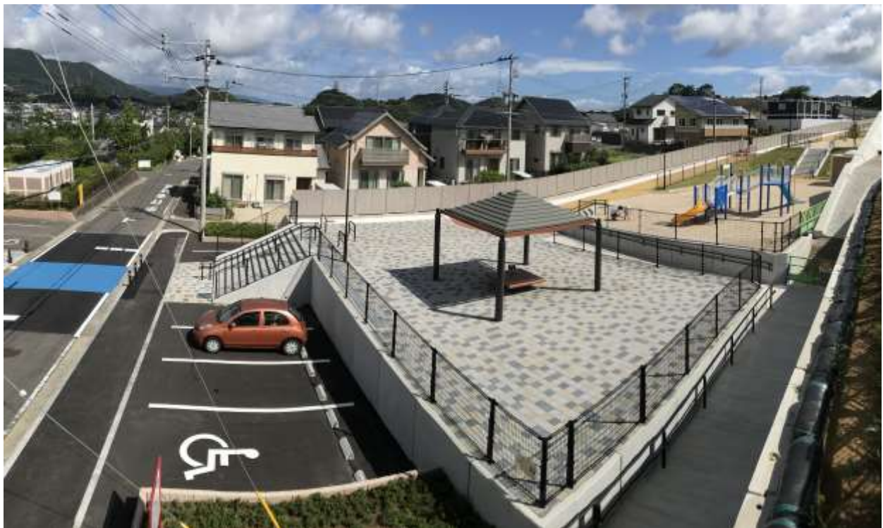
（令和2年7月1日 供用開始）