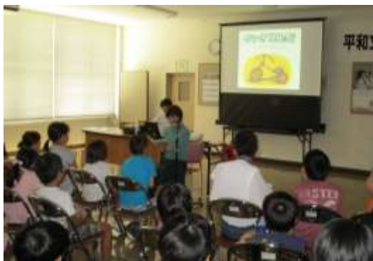
平和文学朗読キャラバン 2019