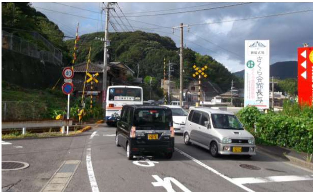
(改良予定の JR 高田踏切)