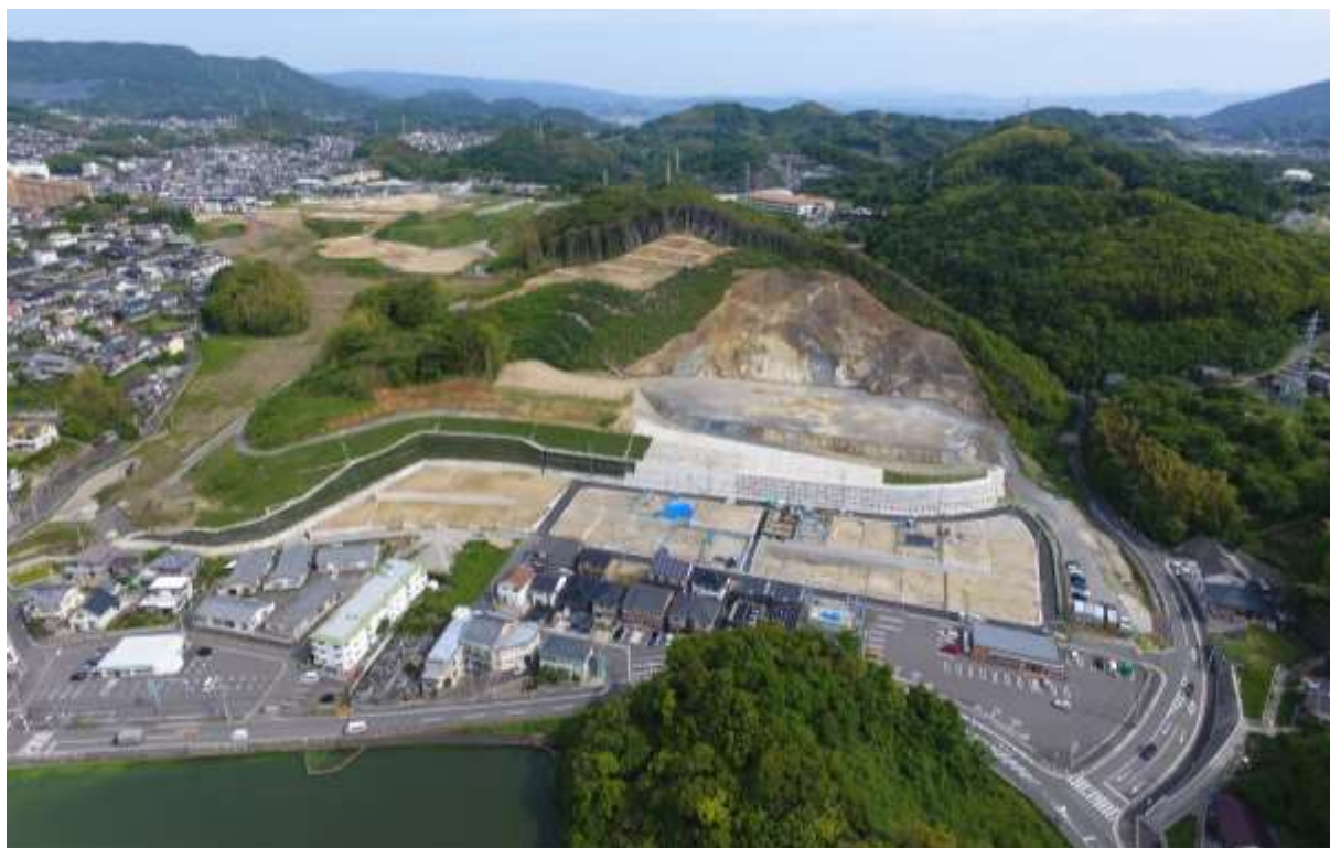
( 浦上水源側から南東部地区を望む )