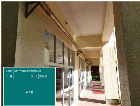
施 工 前