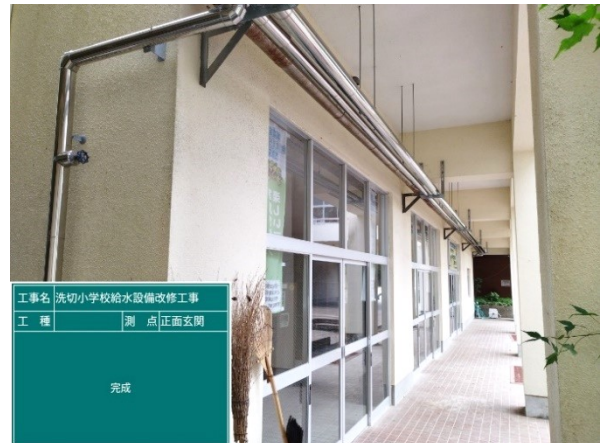
施 工 後