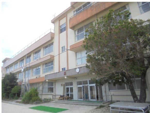
施 工 前