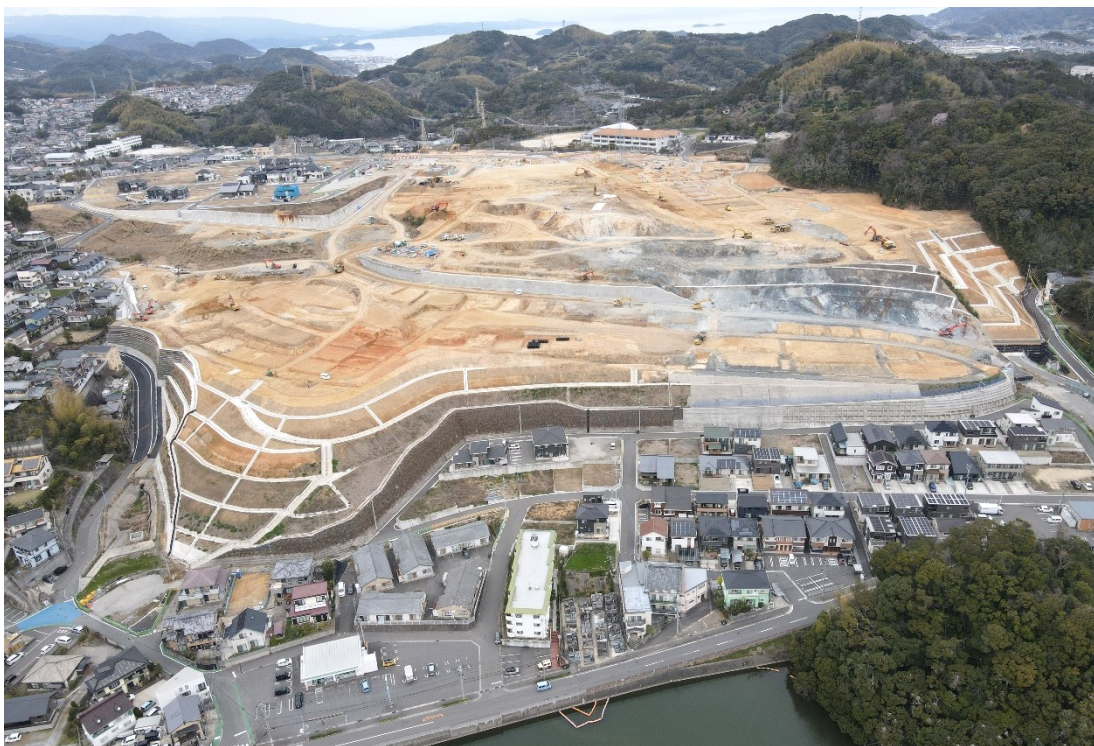
( 浦上水源地側から南東部地区を望む )