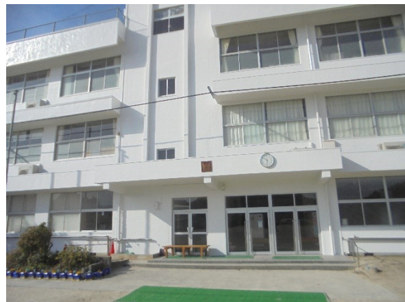
施 工 後