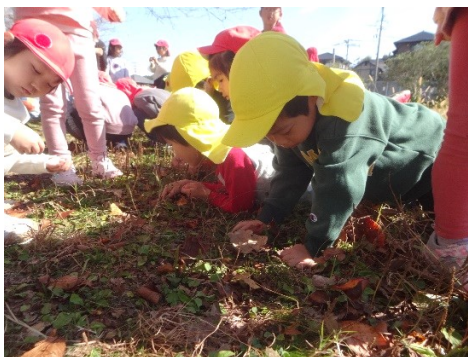
児童対象自然環境教育

自然環境教育については、児童が、自ら自然遊びを行い、草花や虫を友達のように大事にする姿が見られるようになった。