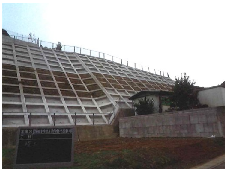
（吉無田（4）地区急傾斜地）

工事費 29,432,700 円、工事延長 L=112m、法面工 A=880 m 2