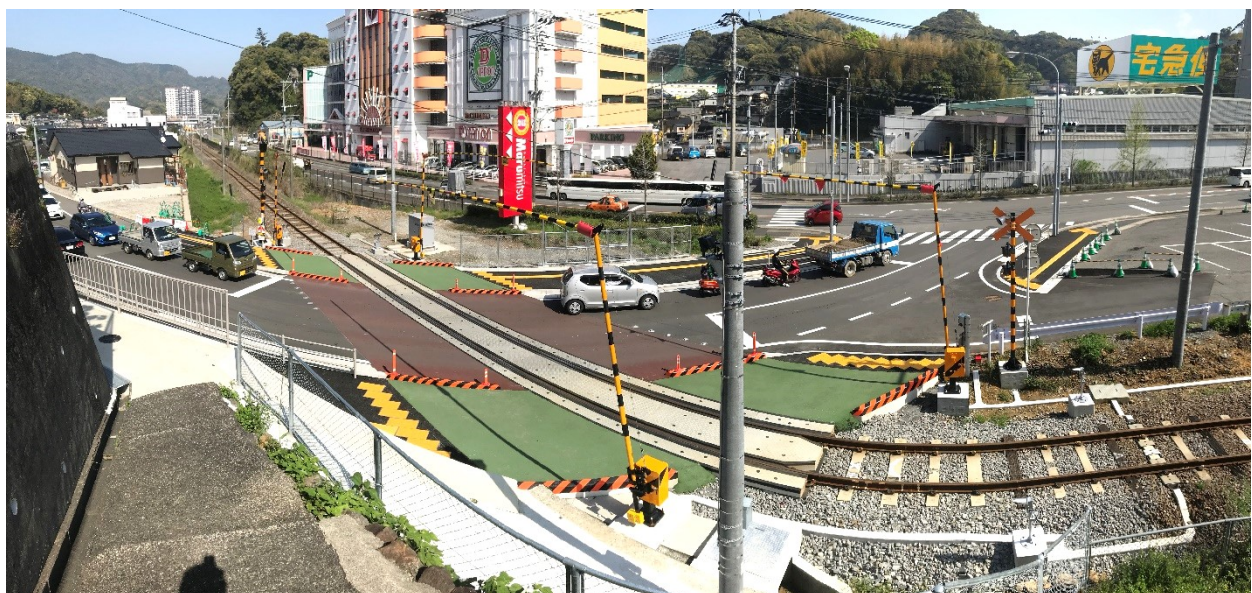
( 改良中の JR 高田踏切付近 )