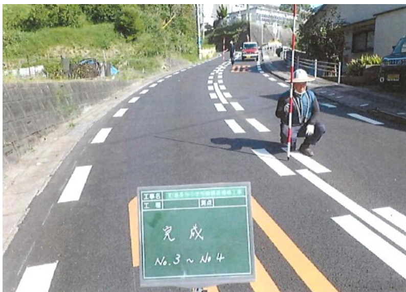
(町道長与中学校線)

工事費 25,940,200 円、工事延長 L=412m、アスファルト舗装工 A=2,469 m 2