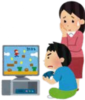
不登校の要因となるゲーム依存に注意

■議員 不登校の児童生徒は令和4年度では小中学校合わせて65人であったが、5年度は86人と、21人も増えている。大幅な増加の要因は何か把握しているか。