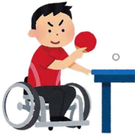
障害の有無に関わらず共に楽しめる卓球

A 紙の削減効果など具体的な金額としては見えてこないが、議会機能の強化、議会活動や事務局の事務の効率化が大きく期待できると考えている。