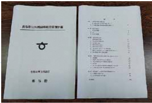
本計画（町HPに掲載）に基づき 今後40年間 年間15億円の費用で手がけていく

■ 議員 今後整備が求められるインフラ施設や公共施設などで想定される多額な改修、更新費用に対応するため、その財源を補填することを目的として、新たな基金（※）の創設を検討してはどうか。 ■ 町長 今後の公共施設等の維持管理、また整備更新については、多額の費用が必要であり、財源の確保は喫緊の課題である。議員指摘のとおり、その財源を補填するために、基金の活用は必要な財源措置と考えている。 ■ 議員 将来の予測を住民にも共有してもらう意味で