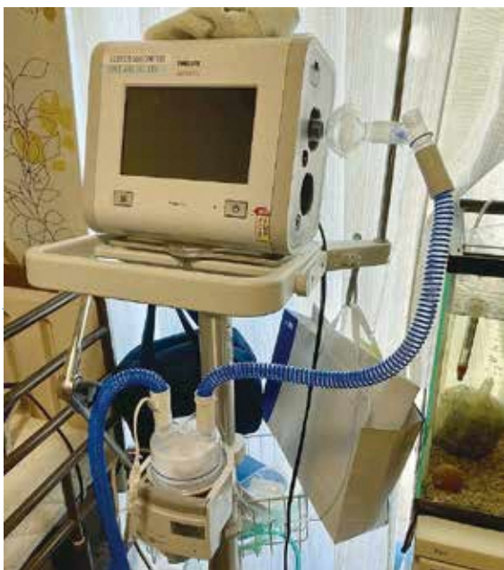
停電が命にかかわる人もいます

本町は指名入札制をとっているが、電子入札導入を機に、その機能を活用して一般競争入札制に移行すれば競争性が増し、落札価格が下がる可能性が高い。浮いた予算を広く住民福祉に使え、加えて先述のさまざまなメリットもあることを考えると、十分に費用対効果があると思うがどうか。 ■ 課長 電子化が時代の流れでもあり、将来的にはいずれ導入することになると思うので、活用できる補助金がないかなど研究していく。 問 特別支援校を福祉子ども避難所に近隣市町と協議の場を持ちたい ■ 議員 熊本市は、熊本地震の際に障害児とその家族が指定避難所に行けなかった教訓から、大規模災害時に障害児と家族が二次避難できる福祉子ども避難所協定を特別支援学校・盲学校と結んでいる。本町も近隣の特別支援学校と