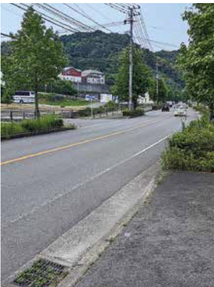
危険な交差点 早く安全対策を！

などを鑑み、要望などがあつた場合には総合的に判断していく。 ■ 議員 総合運動公園の滑り台が撤去されたままになっている。住民から再度、滑り台の設置要望が出ているが設置できないか。 ■ 教育次長 そこを広場として利用する人もいる。議員から聞いた意見も参考にしながら、今後研究していきたい。 問 2017号渋滞緩和に新線建設を 答 建設に向け引き続き協議していく ■ 議員 国道207号の慢性的な渋滞が続いている。そこで、渋滞解消の一助として、北陽台団地北部から時津地区への道路築造を考えてみてはどうか。 ■ 町長 現在、本町と時津町小島田地区を結ぶ路線の構想がある。定期的に、長与町・時津町道路事業調整促進協議会で協議を行っており、整備手法など詳細な協議には至つ