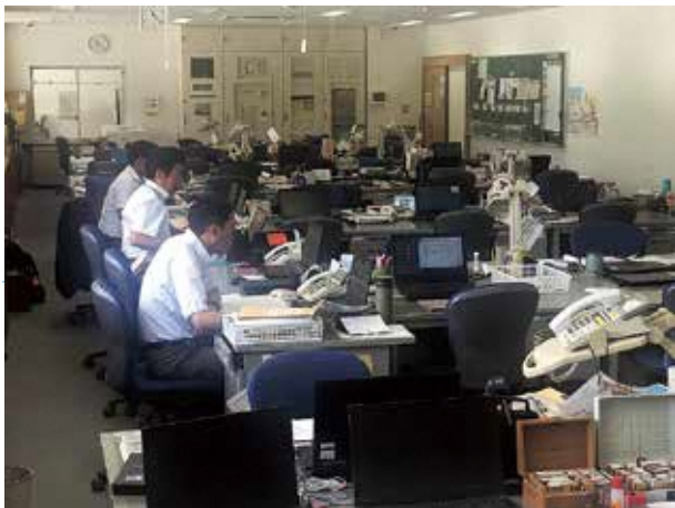
教育現場の働き方改革

り高いが、10日前後の教職員も数名散見される。夏期休暇の取得率は100%である。 ■ 議員 有給休暇や夏期休暇の取得率が低い教員にはどう対処しているか。 ■ 理事 夏期休業などを活用し、計画的に有給休暇を取得するよう指導している。 ■ 議員 勤務間インターバル制度は導入しているか。 ■ 理事 今のところ、勤務間インターバル制度の導入は考えていない。