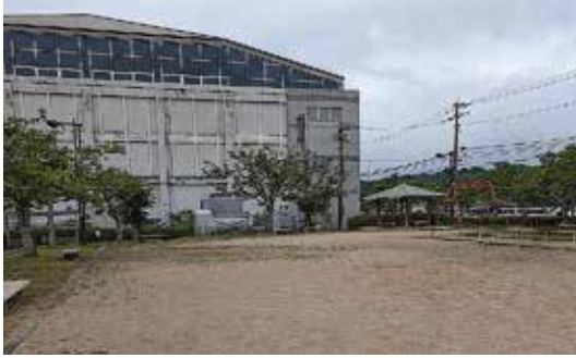
いつでもの 私達の滑り台

■ 議員 本町の公園施設の遊具が撤去されたままになっているのが見受けられるが、新設、有効活用についてはどのようにしているか。 ■ 町長 平成30年度に公園施設長寿命化計画を策定し、都市公園の遊具更新を計画的に実施している。町としては、子どもたちの遊び場を確保する観点を踏まえ、公共施設等総合管理計画の基本的な方針に基づき、施設の廃止や集約化を踏まえながら事業を実施していく必要性がある点や、安全性確保の観点から配置できる遊具の設置を考慮する点