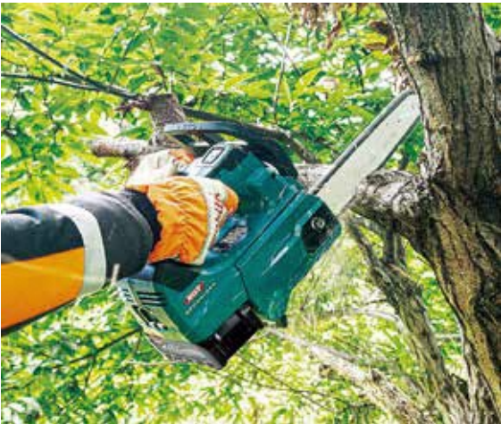
災害時の活躍に期待

A 消防団の力向上モデル事業に応募し、県内では本町のみが採用された。各分団から数名を出し、計21名で構成される。災害時の倒木などの伐採などを行う。今までも個人所有のチェーンソーを使っていたが、今後は消防団活動の中で継続していきたい。