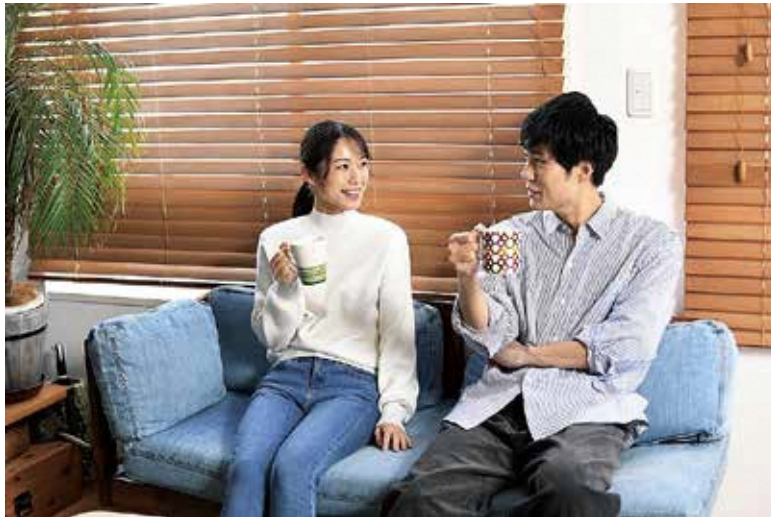
よかった 給食費が昨年度と同額に戻るって

たところ、本町でも活用できないものがあるとのことであった。物価高騰で子育て世帯も教育、子育て費用の捻出で苦労をしている。交付金を活用し、給食費（保護者負担食料費）の値上げを抑えるべきではないか。 ■教育長 3月議会で承認