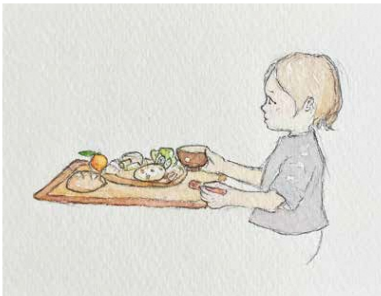
牛乳アレルギーや乳糖不耐症以外の理由での提供停止は学校へ相談を

長が停止やむなしと判断した場合、牛乳の提供の停止を認めている。給食時の牛乳提供の対応は、現状を維持していく考えである。