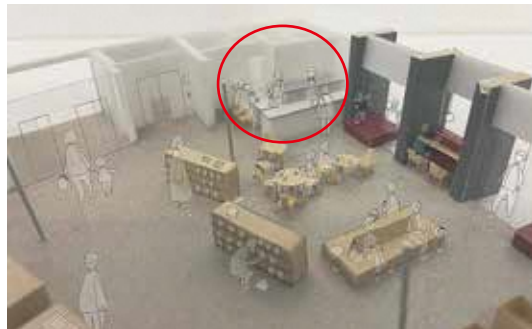
狭すぎるカフェスペース [模型写真]