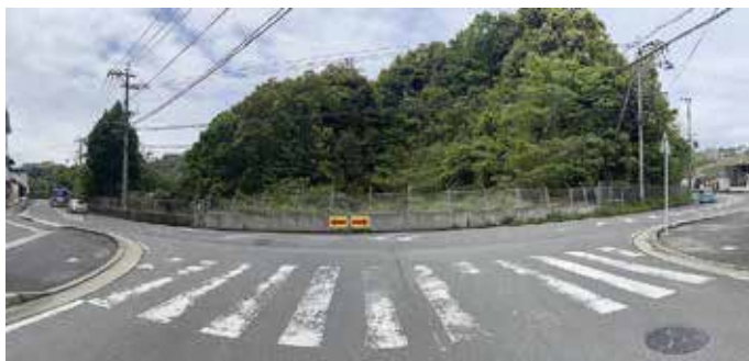
雑木林を公園として整備できないか

■議員 道の尾グラウンドでは精霊流し、鬼火焚き、夏祭りなどが行われ、子どもたちのサッカーやソフトボール、高齢者のランドゴルフなど、健康づくりの場でもある。建物こそ建ってはいませんが、約50年の歴史の中で築き上げてきた伝統や文化があるので、それらを継承できる広さの公園を整備してほしいというのは住民の切なる願いである。長