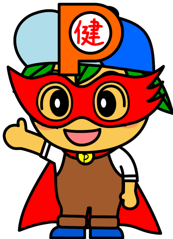
ポイントミックン