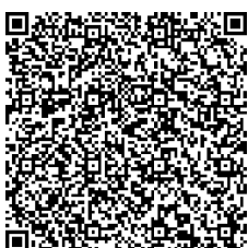
ミックンの絵本も ぜひ読んでね♪