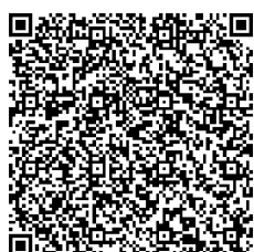
ミックンの絵本も ぜひ読んでね♪