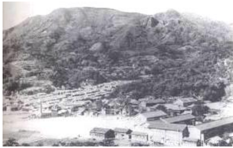
昭和35年頃の丸田岳周辺

※長与ふるさと自然のみちのルートは、開設当時と道路事情により一部変更なっています。