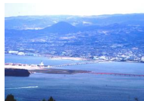
琴ノ岳から見る長崎空港

琴ノ尾岳は、諫早市との境にまたがっており標高451.4m、長与の最高峰である。針尾方面、長崎空港・多良山系の山々が視界に入り、さらに雲仙岳や長崎港までも展望することができる。