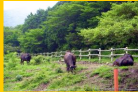
田代原牧場の牛たち