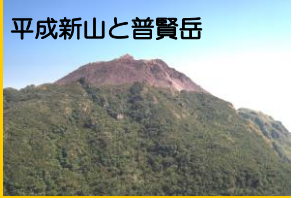
平成新山と普賢岳