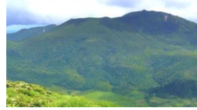
遠くに見える大船山