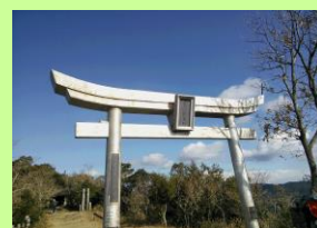
金比羅山山頂にある鳥居

長崎市の中心に位置し市民に最も親しまれている。標高は 366m で長崎市街を一望できる。金比羅神社本宮は昔、長崎奉行や華僑の人たちが海上安全と貿易の繁栄を祈願したという由緒のある神社である。