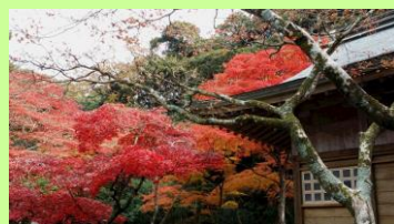
金比羅神社の紅葉