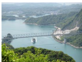
雲龍台から見る 1 号橋

三角岳は宇土半島先端にあり、眼下に天草五橋の 1 号橋などや天草諸島を展望でき、海拔 0m から登ることができる珍しい山。途中の「雲龍台」からの眺めは抜群。