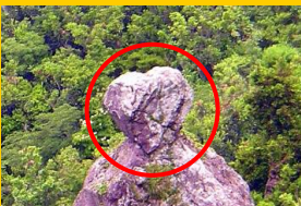
吾妻岳のハート岩