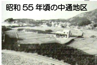
昭和 55 年頃の中通地区