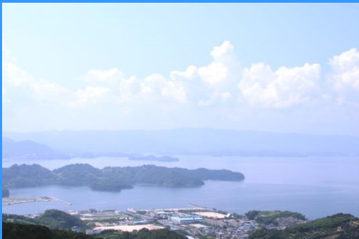
扇塚公園付近から見た大村湾