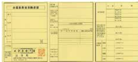
▲介護保険被保険者証(見本)

●町内にお住いで65歳を迎えた方(1号被保険者)に、黄色の“介護保険被保険者証”をお送りしています