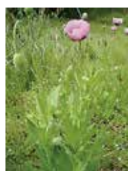
▲植えてはいけないけし