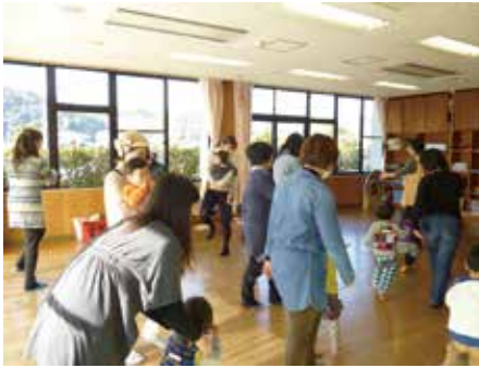
児童館 職員の処遇改善を

■ 議員 4月より子育て支援センターの業務が各児童館で強化されたことで、利用者が増加していると予測するが、児童館側の運営体制の強化はできているか。