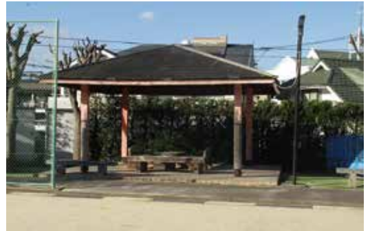
「健幸」につながる東屋が各公園にほしいなあ