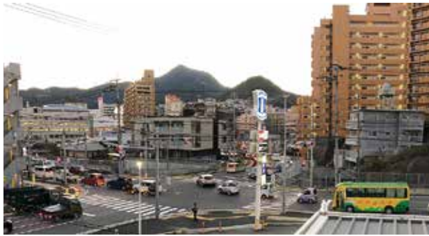
渋滞なんとかして

■ 議員 県道33号線高田郷付近の渋滞解消の対策はあるか。 ■ 町長 長崎南北幹線道路が解消につながると思うが事業化になっていない。