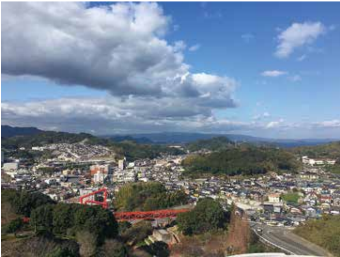
古きよき長与の景観は

■ 議員 自然環境と調和した美しい景観形成の状況と、各種イベントなどとの連携についての考え方はどうか。