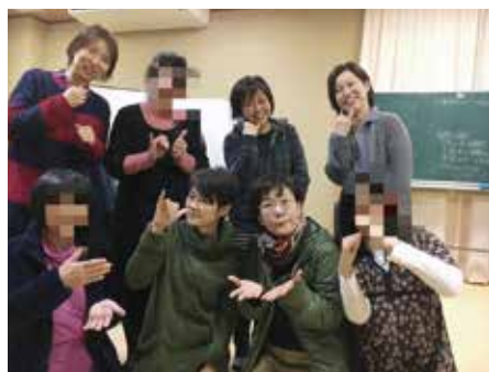
手話言語条例 早く制定して～

■ 議員 手話言語条例の検討はどうか。 ■ 町長 手話に関する事業は、専任手話通訳者の設置、手話奉仕員養成講座の開催、手話通訳者派遣事業を実施している。手話奉仕員養成講座は、延べ1289人が受講した。手話言語条例は、23年の改正障害者基本法により、手話が言語と位置づけられたことから、条例を制定する自治体が増えている。すでに制定済みの自治体から情報収集を行い、研究を進めたうえで、検討していく。 障害者雇用状況は ■ 議員 町の障害者雇用のこれまでの状況や現状はどうか。 ■ 町長 障害者の雇用については、障害者雇用促進法に規定される法定雇用率の達成を念頭に置き、職員採用に取り組んでいる。非常勤職員を全体の職員数に算入することを見失っていたため、障害者雇用率の修正を行った。30年