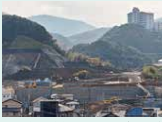
区画整理が進む池山地区（96戸）