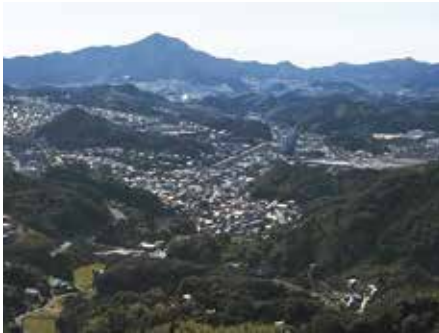
必要なところに、必要なお金を