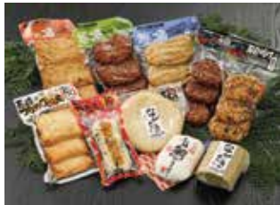
ふるさと納税 人気の返礼品