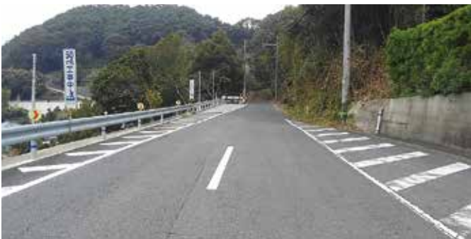
早く、広くしてね国道

道であり、工事、計画についても県の管理下にある。しかし、本町としても本線は、観光目的、緊急時の迂回路、さらに本町の基幹産業である柑橘類の搬送路であり必要不可欠な道路でもある。そのため長崎県、佐賀県の2市5町で構成する「国道207号改良促進期成同盟会」を通じ本町内の未整備区間の早期完成を要望していく。町内でも住民の盛り上がりで期成会ができないか期待している。