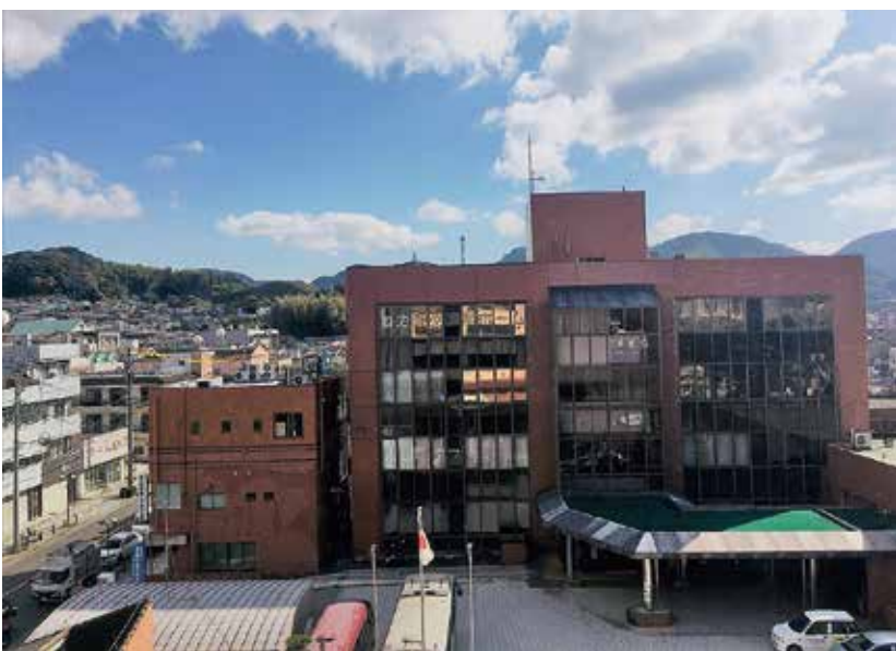
将来を見据えて更新・改修を