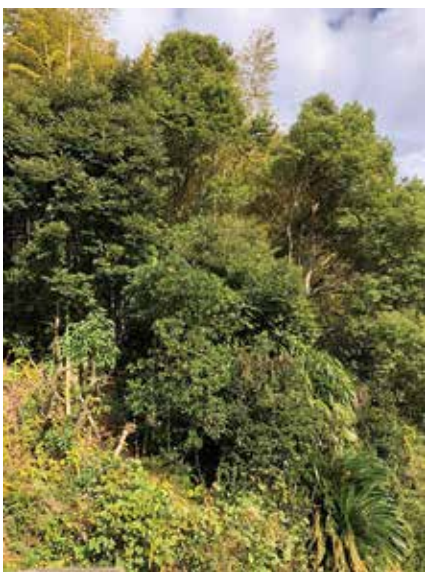
土地所有者不明問題は将来的な課題です