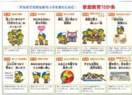
「いじめ多発」学校・家族で話し合ってみよう