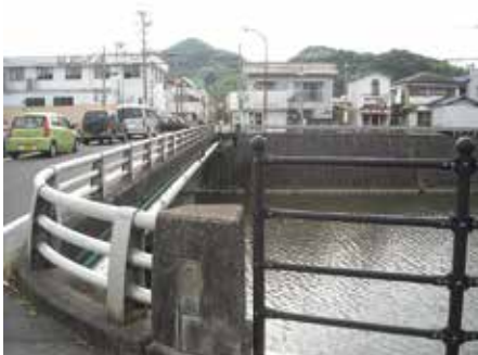
来年度より人道橋設置事業着手予定