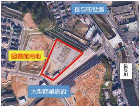
いまだ放置・さらに放置 活用は36年度以降

■ 議員 高田南土地区画整理事業は、県に委託以来32年間が経過しようとしている。現在の毎年度発注方式を、31年度に一括して発注する方式に変更するとの説明があつていた。一括施工の手続き状況と国費確保の状況はどうか。 ■ 町長 一括施工の発注者となる長崎県において、入札契約事務の内容について検討を進めている。国費確保については、国などに要望している。 ■ 議員 いつ頃一括発注できるのか。