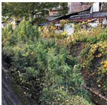
草刈りが望まれる高田川