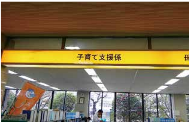
早めの補助実現してね

すると脱水症状も引き起こすこともあり、点滴治療になることもある。この様なロタウイルスにはワクチンがあり、接種し予防することができるともある。時津町でも接種に対し補助を予定している。本町でも補助ができないか。 ■ 町長 予防接種ワクチンは法律により定められており、科学的根拠を基に定期接種か任意接種にするか検討している。ロタウイルスも検討対象ワクチンだが、現在定期接種には至っていない。