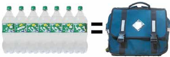
登校するだけでヘトヘトだよ

■議員 小中学生の通学荷物が重すぎるとの意見が出ています。中学生は総重量が10kgを超えることも珍しくない。これは一般的な1・5Lのペットボトルに換算すると、7本以上をバックに詰め登校していることに相当する。登校に30分以上要する生徒は疲労で学習意欲が低下しないか、また、発育に影響はでないか気がかりであるが、対策