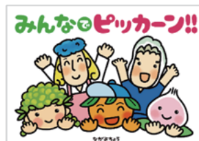
▲感染症対策と心のケアに関する絵本

広報ながよやホームページの子育てサイトにも登場しますので、みなさんぜひ覚えてくださいね♪