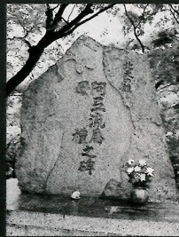
清水寺(京都)境内南苑に立つアテルイ・モレの碑

758年誕生。平安朝初期、「征夷大將軍」に任ぜられ、蝦夷(えみし)の英雄アテルイと戦った知勇の武将。先祖は朝鮮半島から渡来した東漢氏(やまとのあやうじ)。田村麻呂が発願して建立された清水寺(京都)では、処刑されたアテルイをはじめ、朝廷軍・蝦夷軍の分け隔てなく、戦いで亡くなった人々の供養がされている。811年死去。