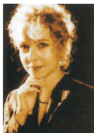
イザベラ ウンテラー Isabella Unterer 【オーボエ】

1957年オーストリア生まれ。1982年から83年までイタリアの Teatro La Fenice (ヴェネツィア)で、その後99年までザルツブルグカメラータ・アカデミカでヴィオラ首席奏者を務めた。プロ・アルテ・カルテットのヴィオラ奏者として世界各地で演奏、CDを多数収録。現在モーツァルトウム音楽院教授。ソリストとして数多くのオーケストラと共演CD収録。また、室内楽奏者としても長年の経験を生かした幅広い活動を繰り広げている。