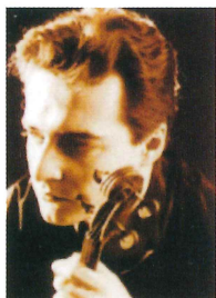
エドアルド オクーン Eduard Okoun 【ヴァイオリンリーダー】

1972年ラトビア生まれ。1980年から90年にかけて、旧ソビエト連邦のオーケストラと共演、ソリストとして早くも活動を開始する。1990年から活動拠点をザルツブルグに移し、ヨーロッパを中心としてソリストとして室内楽奏者として活動。ザルツブルガー室内フィルハーモニーのコンサートマスター兼ミュージックディレクターを務め、この間指揮者としてもデビューを果たした。2000年からオクーン アンサンブルザルツブルグを結成し、リーダーとして活動中。