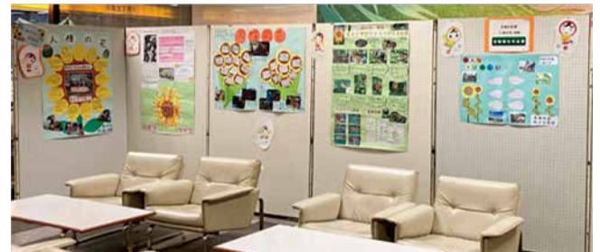
▲令和2年度「人権の花」運動活動報告作品展の様子

主に小学生を対象とした、昭和57年度から実施している啓発活動です。児童たちが種子から花を育成することで、相手と協力すること、相手に感謝することの大切さを学び、人権思想を育むことを目的としています。