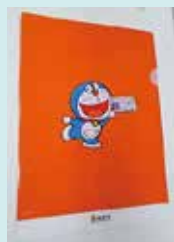
ドラえもんファイル