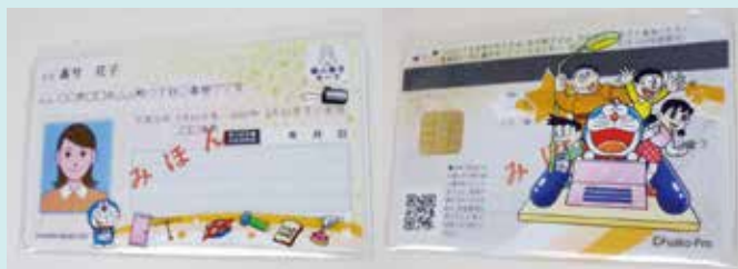
ドラえもん専用ケース