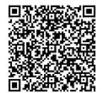
▲集団健診について

詳しくは4月、各世帯配布の「令和3年度長与町健康診査のお知らせ」をご覧ください。