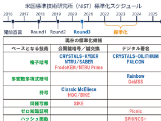
図2 耐量子計算機暗号の標準化動向

さらに、特定の計算において従来の計算機の能力を遥かに凌駕する量子計算機の実現が近づいていると言われています。量子計算機によって、現在使用されている公開鍵暗号やデジタル署名の幾つかは破られることが知られています。量子計算機に対して強い公開鍵暗号やデジタル署名を設計する事が最近の暗号研究のトレンドとなっており、米国標準技術研究所(NIST)が標準化を行っています(図2)。