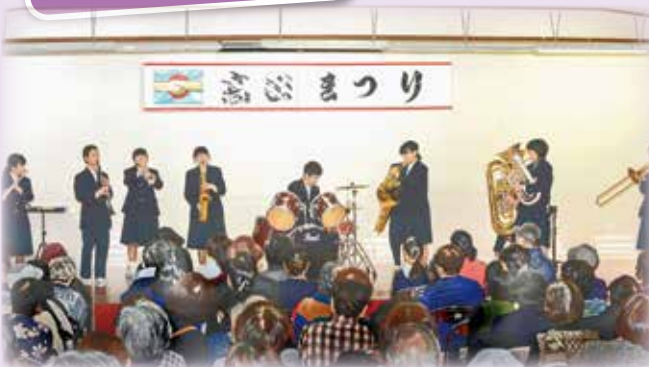
高田中学校吹奏楽部

高田保育所、高田小学校、高田中学校の子どもたちや公民館講座の受講生の方々が成果を発表します。