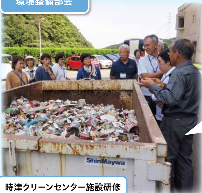
時津クリーンセンター施設研修

年1回程度、環境問題について研修を実施しています。コロナ禍の影響でここ2年研修はできていませんが、令和元年9月25日には、時津クリーンセンターとクリーンパーク長与において、施設の沿革やごみの分別について、焼却場のしくみ・安全性などについて説明を受け、理解を深めました。そして「環境問題」は「ごみ処理の問題」であることを再認識しました。