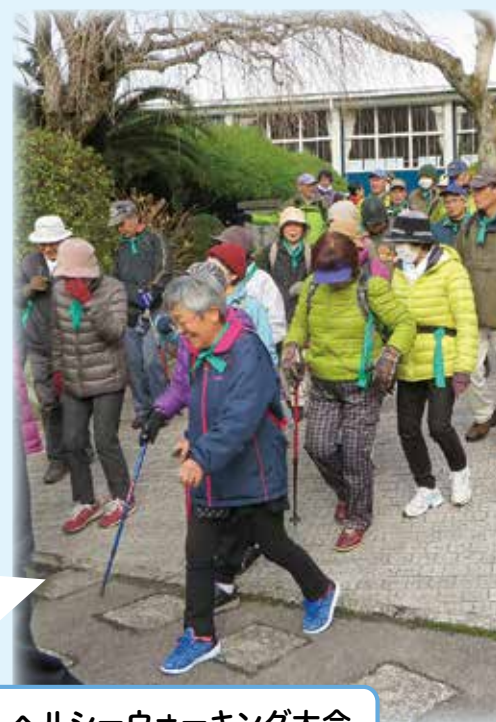
ヘルシーウォーキング大会