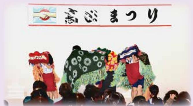
高田小学校「獅子舞」