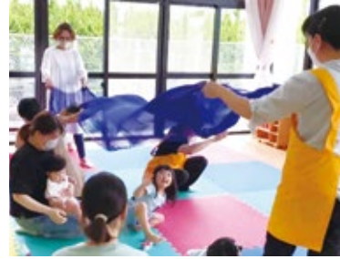
▲ふわりひろば「音楽遊び」