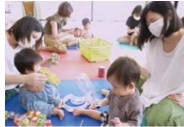
▲にじいろひろば「音楽遊び」