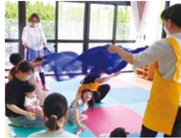
▲ふわりひろば「音楽遊び」