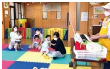
▲すまいるひろば「親子deリトミック」

※みかんちゃんで撮影した写真は、町の広報誌・ホームページなどに掲載することがあります。ご了承ください。