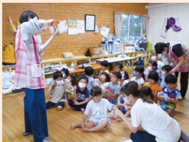
▲ひかり保育園年中・年長児

今年度5回目を迎えた長崎県立大学と町の連携事業で、町内10か所の保育園・認定こども園の年長児向けに実施しました。どの園でも、「あわあわ手あらいのうた」の曲を口ずさみながら、手洗いを頑張る子どもたちの様子が印象的でした。また、「汚れが残りやすい所が分かり意識できた」「正しいマスクのつけ方・サイズ・表裏を理解できた」など感想が聞かれました。