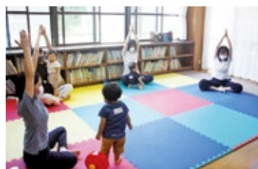
▲つばさデー「親子ヨガ」