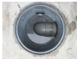
きれいな状態の枡