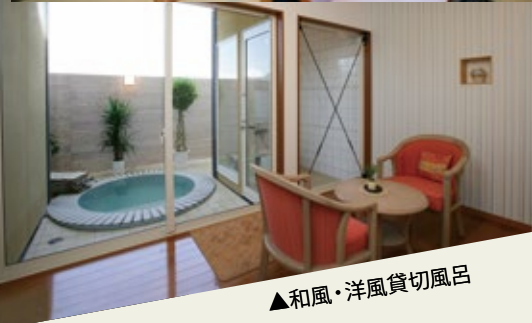
▲和風・洋風貸切風呂