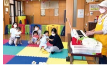
▲すまいるひろば「親子deリトミック」

※みかんちゃんて撮影した写真は、町の広報誌・ホームページなどに掲載することがあります。ご了承ください。