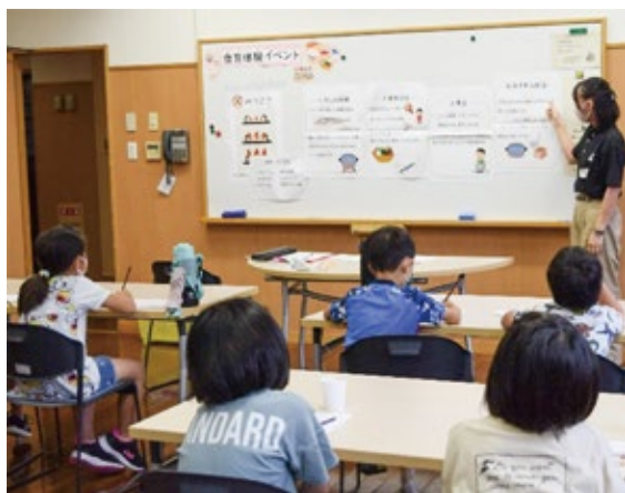
学童保育で食教育を実践している様子