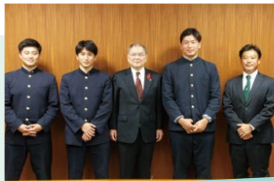
花園出場！ がんばれ北陽台高等学校ラグビー部！

編み物や歌うことが好きで、何でもよく食べることが長寿の秘訣とのこと。どうぞこれからも生き生きと元気で過ごしてください。