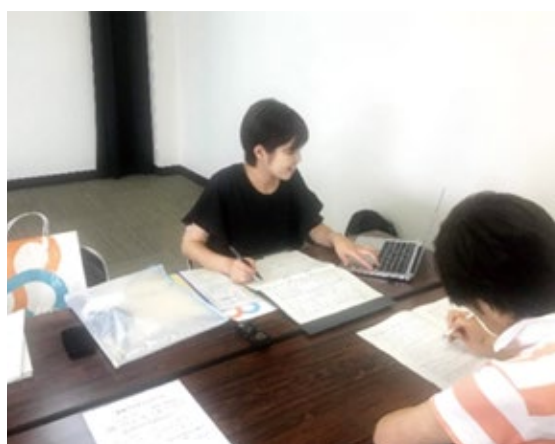
地域で食生活調査をしている様子