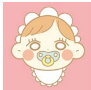
自治会 ベビーチャンネル の「なっちゃん」

自治会に関する動画を投稿しています。是非、チャンネル登録と動画の視聴をお願いします▶