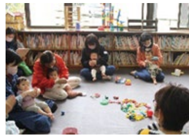
▲つばさひろば「手あそび」