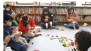
▲つばさひろば「手あそび」