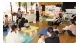
▲ひだまりひろば 「かたり音さんのおはなし会」