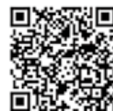
長与町出産・子育て応援事業