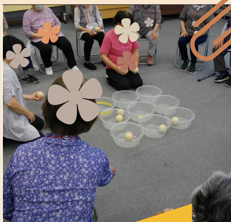
参加者みんな でレクリエーション