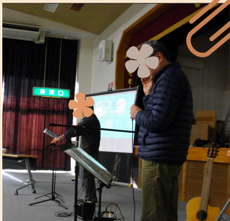
すてきな音楽の時間を