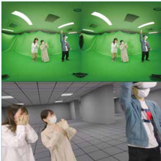
図1 (上) 視野180° 立体視グリーンバック撮影 (下) VR空間での立体映像の再生 撮影時に右目用と左目用の映像を同時撮影するので、VR空間では立体映像として再生される。

VRコンテンツの制作が可能になります。最近注目されているメタバースには地域振興を目的として地域の景観を再現した例などがありますが、このような例では3D景観モデルの作成を手作業でおこなっていることが多く、制作にコストや時間が掛かります。先ほどの技術を使えば低コストでリアルな景観モデルが作成できるので、そこを舞台としたVRドラマを制作して、印象的で効果的な地域プロモーションのメタバースコンテンツを制作できるかもしれません。しかしメタバースのコンテンツはただ作っただけでは十分な効果を発揮しません。マネタイズという収入を得る仕組みを作り出し、持続的にコンテンツを更新していくことも必要になります。物産品の販売や交流人口の増加、コンテンツ産業の創出など地域活性化を図る基盤の創出にも繋がる研究です。