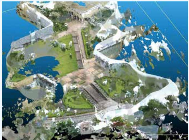
図2 フォトグラメトリによる景観の3D再現 中央階段を歩きながら撮影した360° 動画から作成した3D景観モデル。撮影者から見えない部分は欠落している。