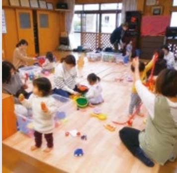
さくらんぼ (嬉里中央自主防災センター)

絵本の読み聞かせや自由遊びなどを通して、親子で・子ども同士で・親同士で一緒に楽しい時間を過ごしましょう♪