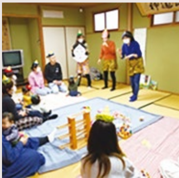
さくらクラブ (長与町公民館2階和室)