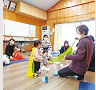
ぴよぴよくらぶ (井手本自主防災センター)