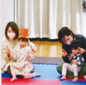
つくしんぼ (サニータウン南公民館)