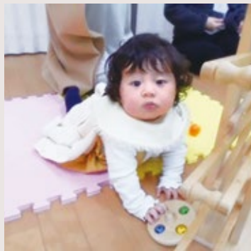
こっこくらぶ (北陽台公民館)