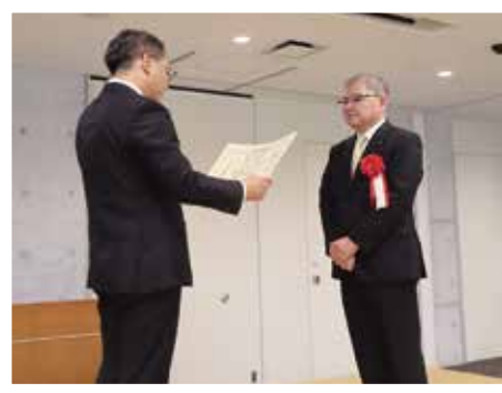
ヘルシータウン賞受賞