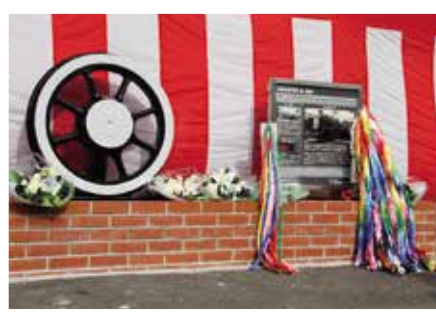
原爆救援列車モニュメント設置 (道ノ尾駅)