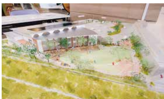
図書館と健康センターの複合施設整備事業