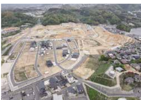
高田南土地区画整理事業