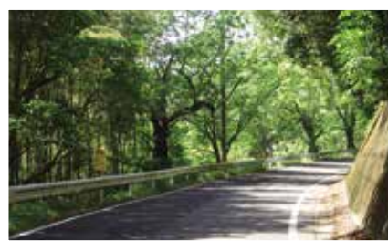
一般国道207号の整備