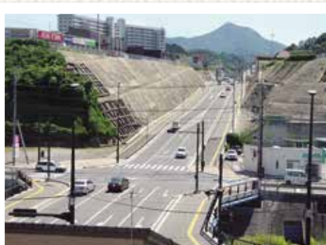
都市計画道路 西高田線