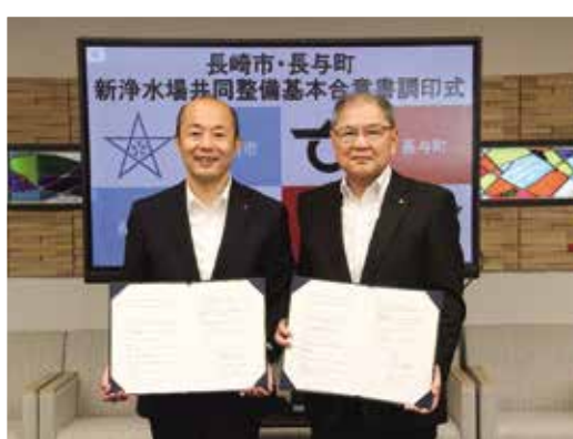
長崎市との新浄水場共同整備事業