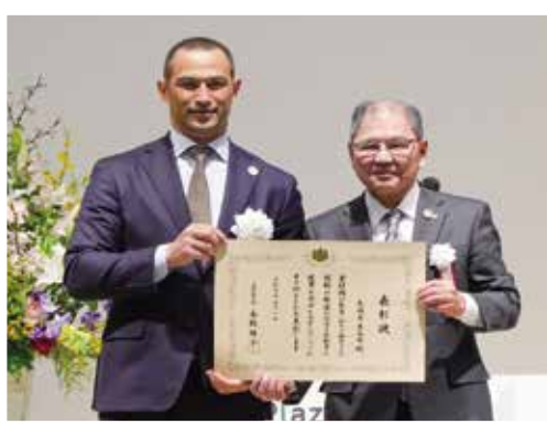
体力づくり優秀組織として文部科学大臣賞受賞