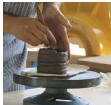
春季講座時の作業風景