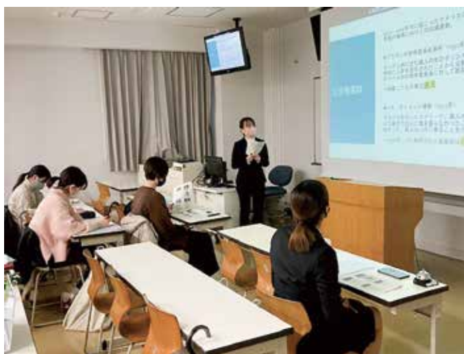
ゼミの卒論発表会の様子