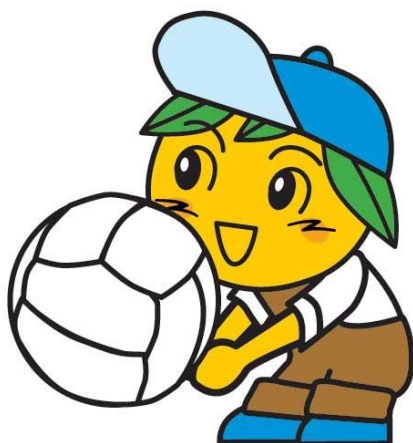
長与町イメージキャラクター ミックン