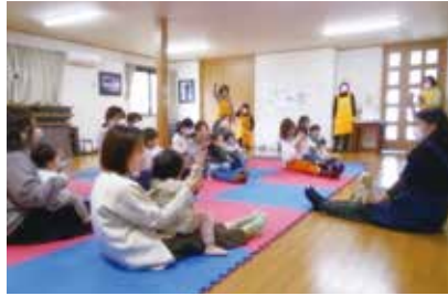
つくしんぼ (サニータウン南公民館)