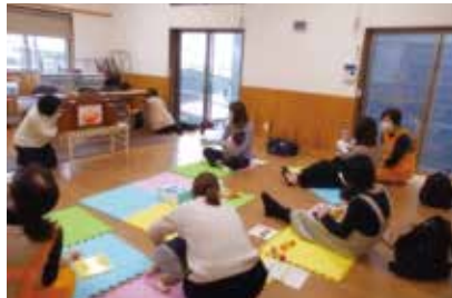
こっこくらぶ (北陽台公民館)