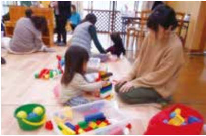
さくらんぼ (嬉里中央自主防災センター)

絵本の読み聞かせや自由遊びなどを通して、親子で・子ども同士で・親同士と一緒に楽しい時間を過ごしましょう♪