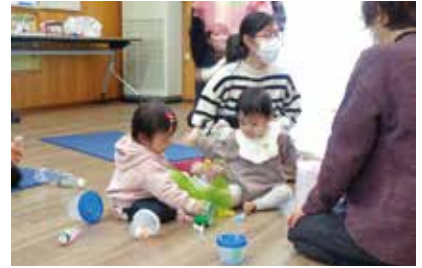
びよびよくらぶ (井手本自主防災センター)