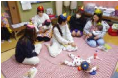
さくらクラブ (長与町公民館2階和室)