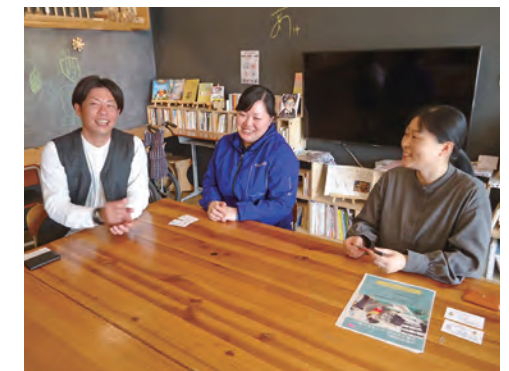
（インタビューの様子）

他にも、利用者の睡眠状態を把握することができる「眠りSCAN」等を導入し、職員の負担軽減をしています。