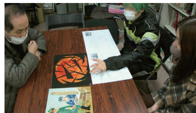
ゼミでの作品の読み込み