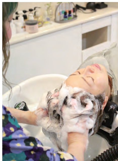
▲1日たった3分の髪が育つシャンプー術をお伝え中