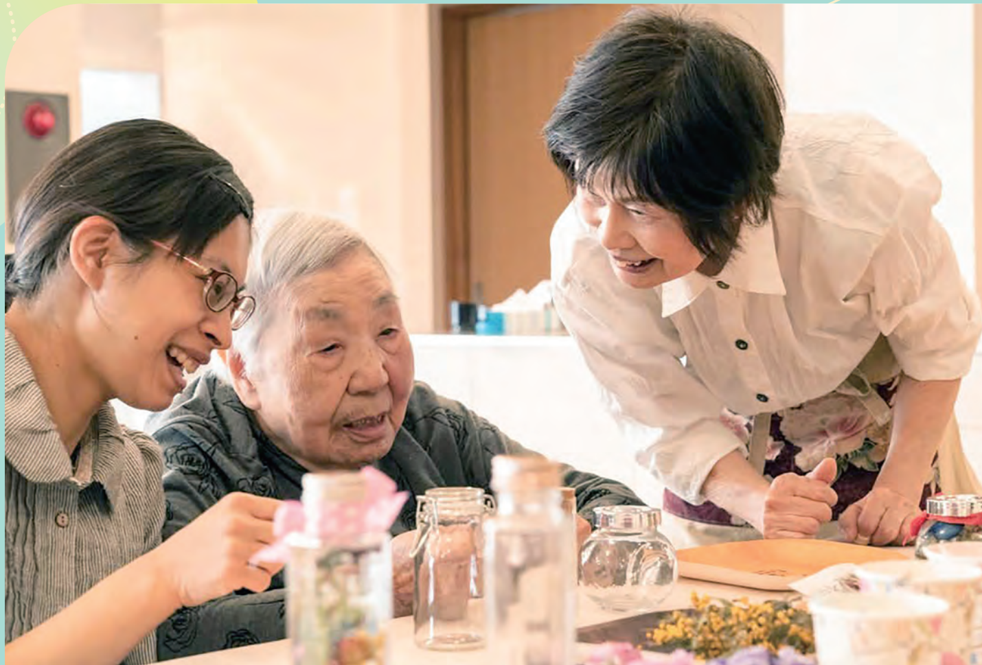
グループホームながよの様子