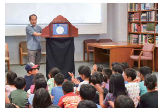
図書館紙芝居会でのひとこま