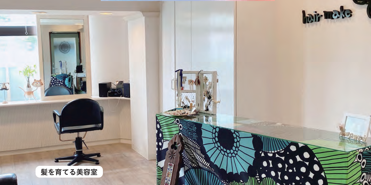
髪を育てる美容室