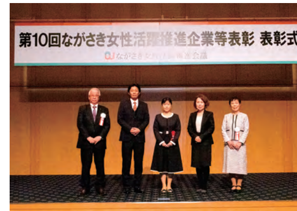
（令和6年度 ながさき女性活躍推進企業等表彰式）

長与町には、女性活躍の分野で表彰された企業、子育てサポート企業として認定を受けた企業があります。誰もが能力を発揮し、多様な働き方ができる社会を目指した取り組みを行っている町内の企業をご紹介します。