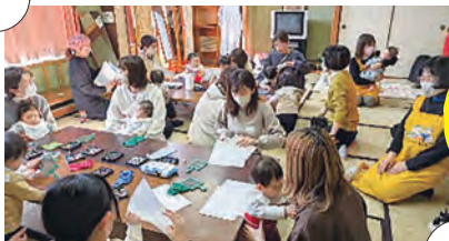
さくらクラブ (長与町公民館) の様子

町には、地域の方が結成した5か所の「子育て支援自主サークル」があります。0歳児から自由に行くことができる遊び場です。絵本の読み聞かせや自由遊びなどを通して、親子で・こども同士で・親同士と一緒に楽しい時間を過ごしましょう♪