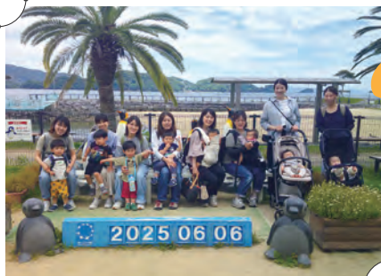
親子バスハイク~ペンギン水族館~