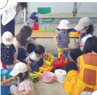
グラウンドであそぼうday