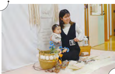
マタニティフォト(平日開催)