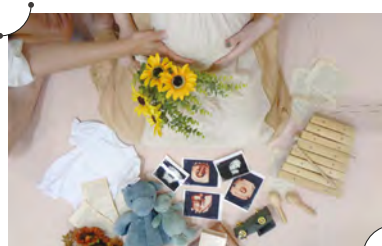
エコ写真と一緒に♪